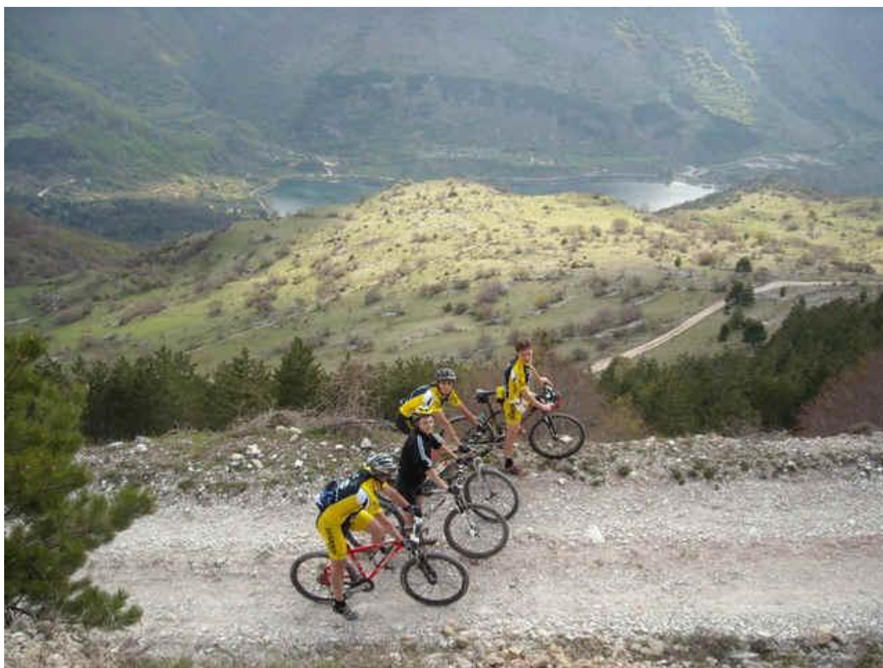
Foto 1 Il Lago di Scanno visto da Frattura

Percorrendo Viale del Lago si lascia l'abitato di Scanno e in 5 Km.di salita asfaltata si raggiunge Frattura. L'abitato di questa splendida frazione di Scanno potrebbe definirsi come “un balcone che affaccia sul Lago” . Infatti il paesino, posto a m 1260, offre una vista mozzafiato sul sottostante lago posto a m. 930.