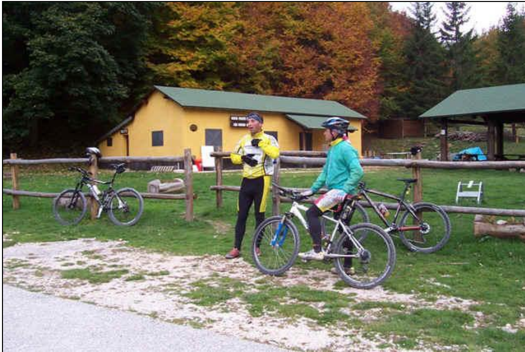
l’area di pic-nic della Montagna Spaccata

Si inizia a scendere e dopo circa 500 m. si svolta a sx e percorrendo un tratto in diagonale si imbecca la “ VALLE GENTILE” una lunga discesa in sottobosco che in 6 km. circa arriva sulla vecchia “ NAPOLEONICA” antica via che costituisce l’ultima porzione originale della Real Strada degli Abruzzi, nel tratto che unisce Pettorano con Rocca Pia, costruita verso la fine del 1700, era considerata una importantissima arteria viaria dell’epoca. Collegava Napoli con Pescara. Si prosegue verso dx fino a raggiungere il Piano delle Cinque Miglia da dove è possibile raggiungere i comuni di Rivisondoli, e Pescostanzo. Mantenendo la destra, proseguendo su una evidente sterrata, si entra in una gola molto suggestiva che in circa 2 km. ci conduce all’area pic-nic della Montagna Spaccata un’oasi naturale